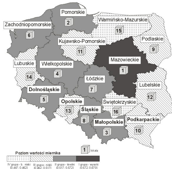
Rys. 2. Miernik kapitału ludzkiego według województw w 2006 r.